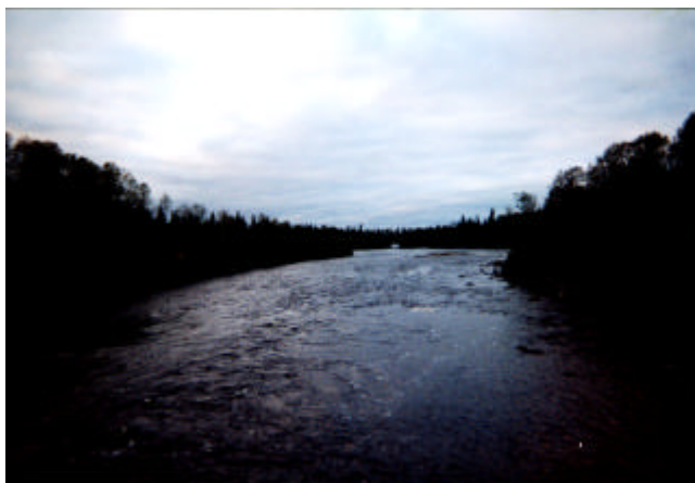
La rivière Mégiscane