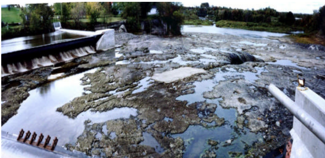
Centrale au fil de l'eau et rivière Nicolet asséchée.

Certains prétendent, comme Boralex, qu'« on parle d'une centrale au fil de l'eau, qui est peu dommageable pour l'environnement ». Or, ces photos du barrage de Ste-Brigitte-des-Saults sur la rivière Nicolet, qui est également un barrage au fil de l'eau, montrent à quel point un site peut être complètement défiguré !