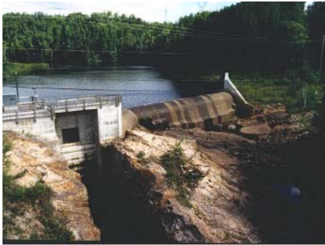
Barrage « au fil de l'eau » sur la rivière du Loup à Saint-Paulin

Pour sa part, Jean-Claude Germain s'insurge contre les détournements d'idées et les contorsions de l'esprit « Les municipalités et les promoteurs s'approprient gaillardement un bien collectif en jouant effrontément les juridictions et les réglementations les unes contre les autres ». Il ajoute : « Comment faire confiance à des promoteurs qui traînent en justice le ministre de l'Environnement et qui refusent d'aller en audiences publiques comme c'est le cas dans le dossier de la rivière Batiscan ? Le ministre de l'Environnement n'a quant à lui toujours pas répondu à la demande d'audiences publiques des citoyens de Trois-Pistoles, forts d'une pétition régionale qui compte 1 502 noms » tonne-t-il, afin de bien souligner, qu'une fois de plus l'histoire se répète, et risque fort de se répéter partout ailleurs.