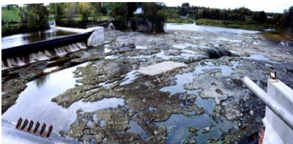
Barrage au fil de l'eau et rivière Nicolet asséchée à Ste-Brigitte-des-Saults

Certains parlent de « centrales au fil de l'eau » peu dommageables pour l'environnement. Mais les photos suivantes montrent bien que de telles constructions défigurent complètement les sites.