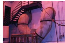
Les tuyaux d'amendé d'eau à l'intérieur de l'usine de filtration, Hull, le 1 er juin 2001.

C'est exactement ce qu'a fait la Ville de Moncton en donnant à la US Filter (filiale de Vivendi/Veolia), le contrat de bâtir la nouvelle usine de filtration. La portion d'intérêts incluse dans les paiements frôle les 10% alors que la Ville se finance à moins de 6%. Les paiements annuels sont de plus de 10% supérieurs à ce qui avait été déclaré par la Ville pour justifier la signature. Ça coûte cher parfois de vouloir cacher ses dettes. La Ville de Moncton a repris le contrôle de son service d'eau, mais sa petite aventure aura coûté une fortune aux citoyens pour sacrifier à l'idéologie à la mode. Le gouvernement a mis fin à cette histoire car, en plus, les élus de Moncton avaient contourné la Loi pour arriver à leurs fins. Malheureusement, d'autres victimes n'auront pas nécessairement cette chance.