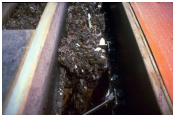
Résidus de grilles récupérés après le dégrillage

Pour améliorer l'accès au fleuve des riverains, la Ville de Montréal étudie présentement plusieurs systèmes pour désinfecter les eaux usées, mais on devra probablement attendre encore quelques années pour qu'il soit mis en place. Il faudra investir plusieurs millions de dollars pour diminuer efficacement la pollution produite par les eaux usées de l'île. Les Montréalais sont-ils prêts à payer la facture ?